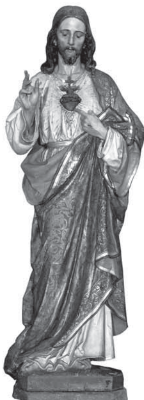
20. Josef Obletter, Srce Isusovo , 19./20. st., Župna crkva Presvetog Trojstva, Sv. Križ Začretje, polikromirano drvo

Drvorezbarsko majstorstvo Josefa Oblettera ponajviše dolazi do izražaja na kipu Srca Isusova u župnoj crkvi u Svetom Križu Začretje. Drveni polikromirani kip većih dimenzija odlikuju dobre proporcije i vješta izrada detalja, među kojima se ističe perfekcija bojenja inkarnata vidljiva na Kristovim rukama i licu. Draperije su oslikane minucioznim damastiranjem koje je do danas ostalo sačuvano. Lik Krista spada u prototipove koji svoj uzor pronalaze u Thorwaldsenovu kipu Krista iz 1819. godine, koji svojom majestetičnom pozom i elegičnim izrazom lica navješćuje tipologiju koju preuzima nazarensko slikarstvo, a kontinuirano do konca 19. st. U skladu s onodobnim vjerskim propisima za župnu crkvu u Kotoribi nabavljaju se u Obletterovoj radionici kipovi Srca Marijina i Srca Isusova, uklopljeni u neogotičke baldahine, koje možemo svrstati među popularne devocionalije masovne proizvodnje, dok je vrlo ekspresivno