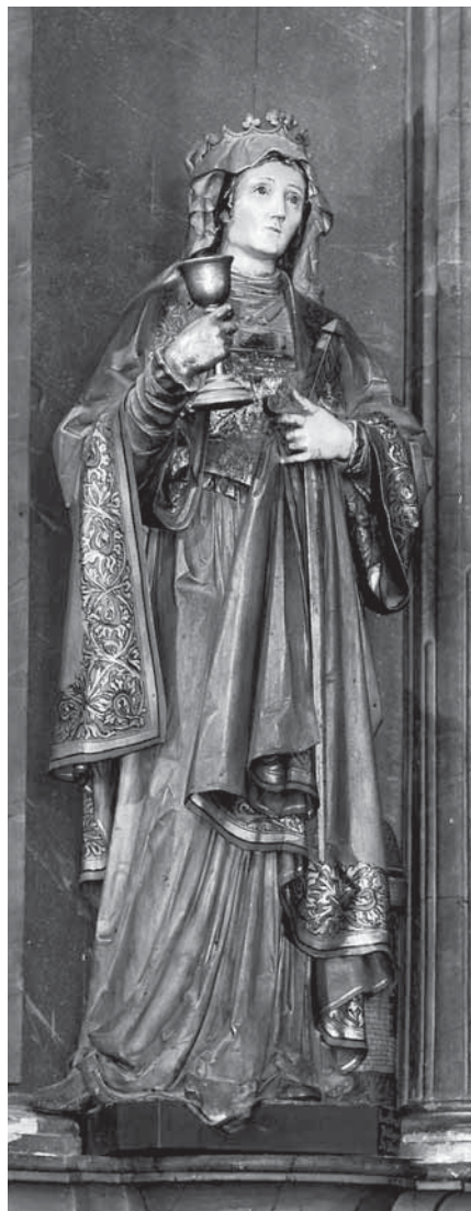
10. Ferdinand Prinoth, Sv. Barbara , glavni oltar crkve Sv. Katarine u Krapini, polikromirano drvo