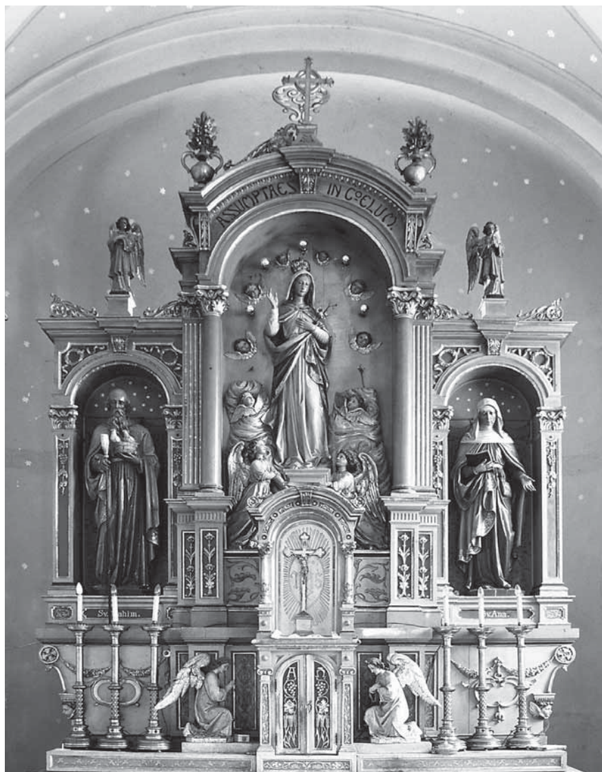
18. Konrad Skasa, Glavni oltar župne crkve Uznesenja Bl. Dj. Marije Peščenica u Turopolju, 19./20. st., drvo, polikromirano, pozlaćeno

Zanimljiv i kvalitetno na solidnoj razini opus Konrada Skase nalazimo u župnoj crkvi Uznesenja Bl. Dj. Marije u turopoljskoj Peščenici. Glavni oltar, signiran Konrad Skasa Atelier für Kirchliche Arbeiten St. Ulrich, Gröden, Tirol , tipičan je tirolski rad oltara obloga luka s trodijelnom podjelom niša za kipove Uznesenja Marijina okružene brojnim kerubinima i