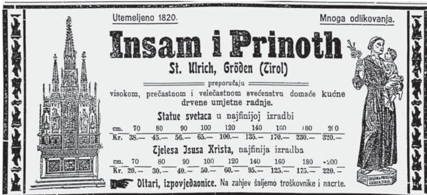
1. Insam i Prinoth, Oglas u Katoličkom listu , 1902.