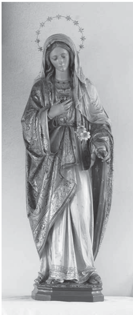
13. Insam i Prinoth, Srce Marijino , 1908., Kapela Srca Isusova u Strmcu kod Remetinca, polikromirano drvo