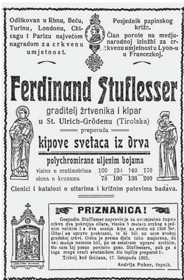
2. Ferdinand Stuflesser, Oglas u Katoličkom listu , 1902.