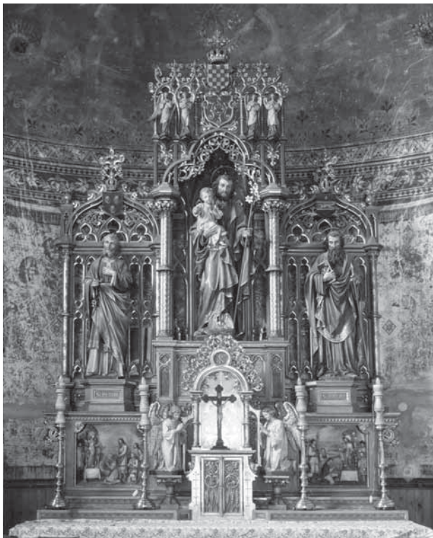
5. Ferdinand Stuflesser, Glavni oltar župne crkve Sv. Josipa u Grubišnom Polju , 1907., drvo, polikromirano, pozlaćeno