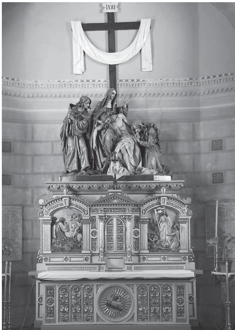
21. Josef Obletter, Oltar Žalosne Bogorodice s Božjim grobom, 1911., Župna crkva Sv. Martina, Varaždinske Toplice, drvo, polikromirano, pozlaćeno

Oplakivanje velikih dimenzija smješteno na pobočni oltar župne crkve u Varaždinskim Toplicama iz 1911. godine. 56 (sl. 20, 21)