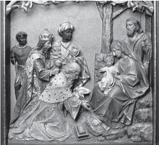
9. Insam i Prinoth, Poklonstvo kraljeva , reljef na glavnom oltaru u Zajezdi, 1902., polikromirano drvo