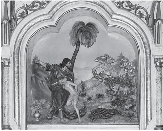
4. Ferdinand Stuflesser, Abraham žrtvuje Izaka , 1897., reljef na glavnom oltaru crkve Uznesenja Marijina u Molvama, polikromirano drvo