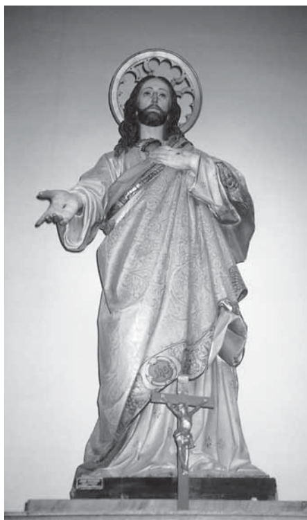
22. Josef Rifesser, Srce Isusovo , 19./20. st., Župna crkva Sv. Ivana Krstitelja, Ivanska, polikromirano drvo

Drvorezbarska dinastija Rifesser dala je nekoliko kvalitetnih majstora. Ističu se radovi Josefa Rifessera, osnivača ugledne radionice koja je djelovala u St. Ulrichu, u kojemu je on godine 1885. postavljen za gradonačelnika. Sudjelovao je pri obnovi tamošnje župne crkve, koja je krajem 19. st. proširena. Izrada oltara za novopridodane kapele povjerena je najuglednijim radionicama i majstorima, Ferdinandu Stuflesseru i Josefu Rifesseru. Na području sjeverozapadne Hrvatske djela Josefa Rifessera nalaze se u crkvi Sv. Katarine u Nevincu. Na konzolama pod baldahinima postavljeni su 1905. kipovi Srca Isusova i Srca Marijina. Jedan od ponajboljih radova tirolske oltaristike 19. st. oltar je Srca Isusova s ukomponiranim Božjim grobom podignut u župnoj crkvi Sv. Ivana Krstitelja u Ivanskoj, na kojem je do danas sačuvana izvorna polikromacija finog inkarnata i minuciozno oslikane draperije. Godine 1910. reprezentativan kip Srca Isusova nabavljen je od Josefa Rifessera za crkvu Pohoda Bl. Dj. Marije u Vukovini. (sl. 22)