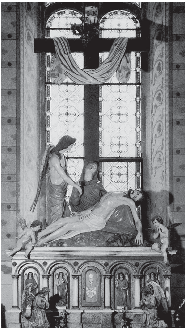
15. Franz Schmalzl, Oltar Žalosne Bogorodice, poč. 20. st., Ludbreški Sveti Đurd, polikromirano drvo