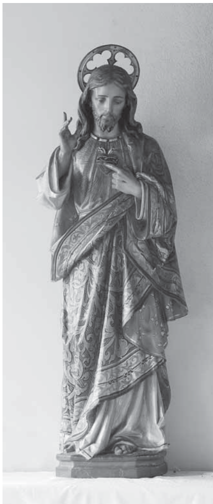
12. Insam i Prinoth, Srce Isusovo , 1908., Kapela Srca Isusova u Strmcu kod Remetinca, polikromirano drvo