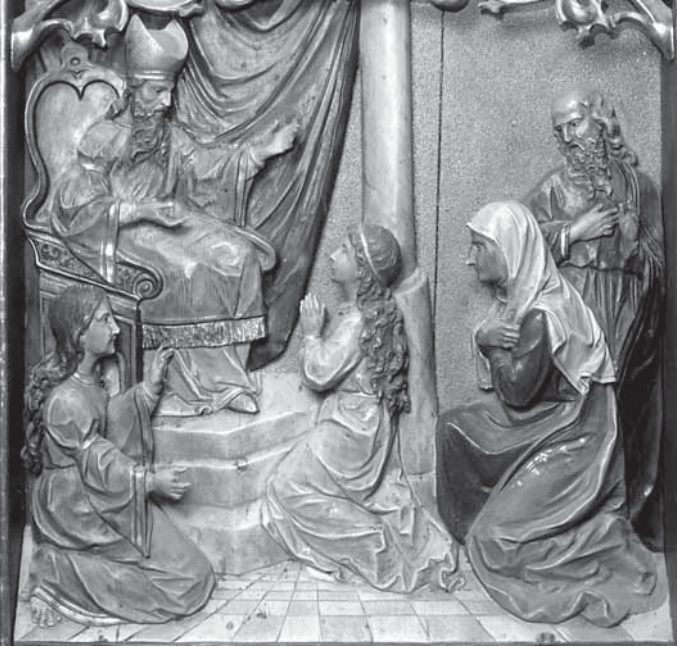
8. Insam i Prinoth, Prikazanje Bogorodice u Hramu , reljef na glavnom oltaru u Zajezdi, 1902., polikromirano drvo