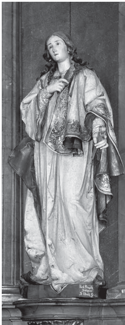
11. Ferdinand Prinoth, Sv. Apolonija , glavni oltar crkve Sv. Katarine u Krapini, polikromirano drvo