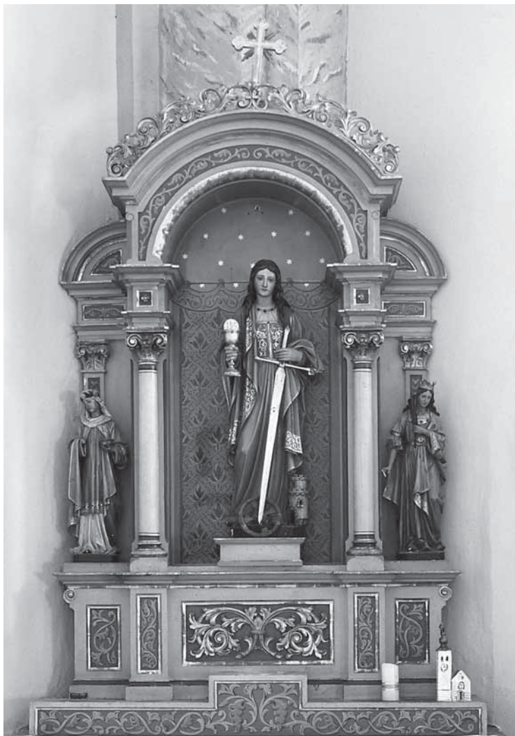
19. Konrad Skasa, Pobočni oltar sv. Barbare, Župna crkva Uznesenja Bl. Dj. Marije Peščenica u Turopolju, 19./20. st., drvo, polikromirano, pozlaćeno

adorantima, i asistentnim kipovima sv. Joakima i Ane. Stilski ujednačeni su i pobočni oltari sv. Antuna sa svetim Ćirilom i Metodom, te oltar sv. Barbare sa sveticama Lucijom i Katarinom. Oltari su do danas ostali sačuvani u svojoj izvornoj polikromaciji i predstavljaju značajan primjer tirolske sakralne skulpture s kraja 19. i početka 20. stoljeća. Kipovi ovog majstora nabavljeni su i za župnu crkvu Sv. Nikole u Krapini (oltar sv. Josipa, 1909.), dok je kip sv. Antuna Padovanskog u novije doba premješten u kapelu cinktora na Trškom Vrhu. (sl. 18, 19)