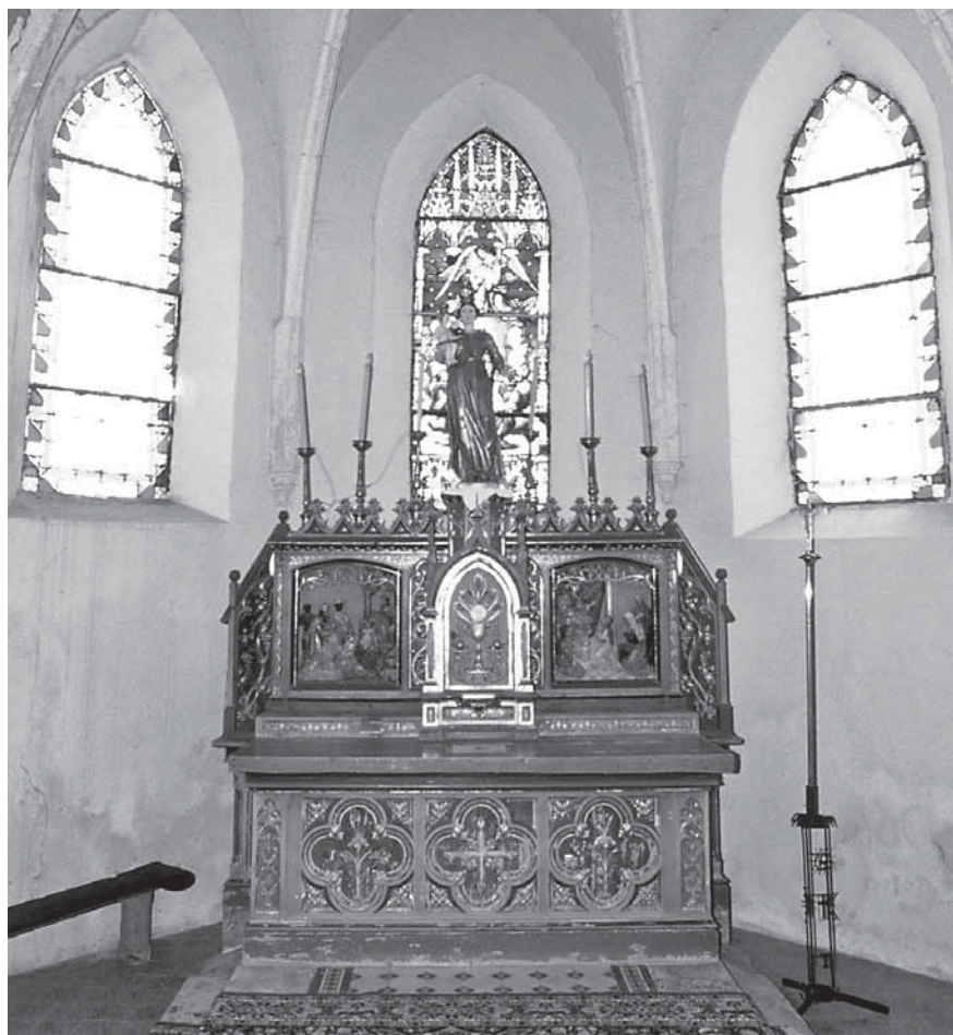
7. Insam i Prinoth, Glavni oltar župne crkve Uznesenja Marijina u Zajezdi, 1902., drvo, polikromirano, pozlaćeno

postavljen je 1908. godine u istoimenu kapelu u Šemovcima (župa Virje u Podravini), 37 a crkva Sv. Duha u slavonskim Feričancima opremljena je također Prinothovim oltarima i kipovima. 38 Komparativna djela, skulpture Srca Isusova, 1897. i sv. Florijana, 1900. Insama i Prinotha nalaze se u crkvi Sv. Henrika u Bleiburgu. 39 (sl. 7, 8, 9, 10, 11, 12, 13)