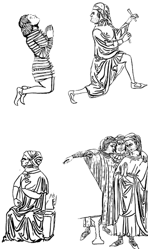
Muška građanska i plemićka nošnja na reljefima škrinje sv. Šimuna