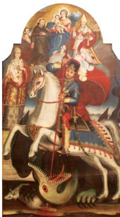
14. Filippo Naldi, Bogorodica s Djetetom, sv. Jurjem, sv. Franjom i sv. Nikolom , Drašnice (Makarska), Župna crkva sv. Jurja

Filippo Naldi, The Immaculate Conception with Saints, Drašnice (Makarska), parish church of St George