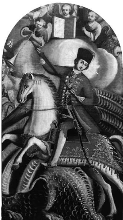
3. Filippo Naldi, Sv. Juraj , Žeževica (Omiš), Župna crkva sv. Jurja Filippo Naldi, St George, Žeževica (Omiš), parish church of St George