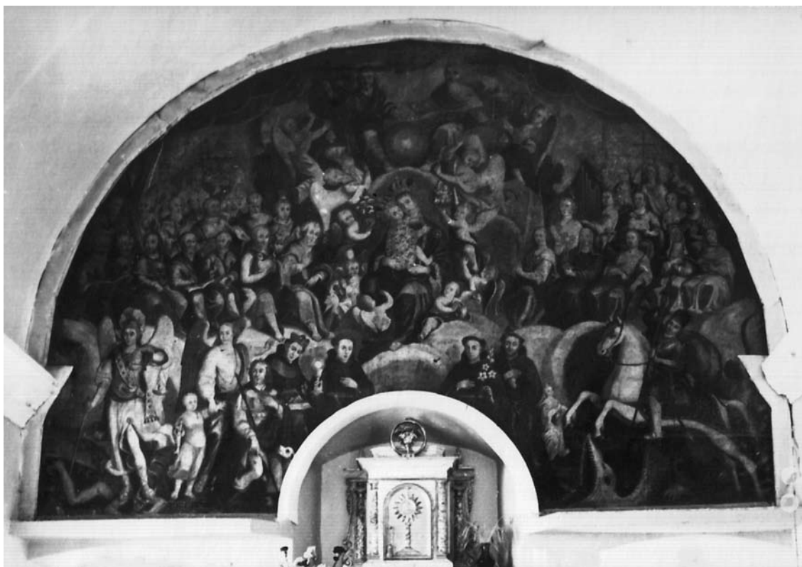
8. Filippo Naldi, Bogorodica s Djetetom, Presvetim Trojstvom i svecima , Slivno (Imotski), Župna crkva Presvetoga Trojstva

Filippo Naldi, The Virgin with Child, the Holy Trinity, and Saints, Slivno (Imotski), parish church of the Holy Trinity