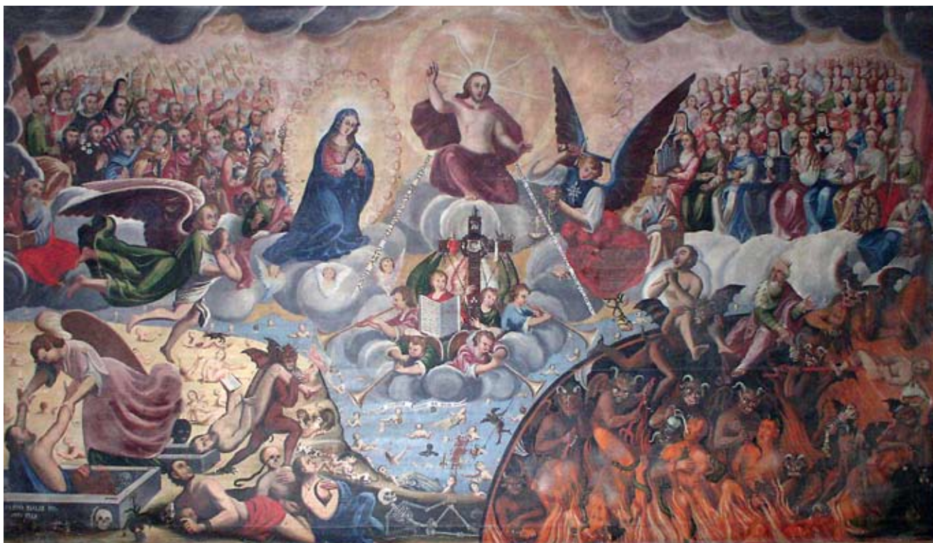
2. Filippo Naldi, Posljednji sud , Katuni (Omiš), Župna crkva Uznesenja Blažene Djevice Marije Filippo Naldi, The Last Judgment , Katuni (Omiš), parish church of the Assumption of the Virgin

su svetački likovi shematizirani, oblikovani poput ikona, s prepoznatljivim atributima i simbolima, popraćeni ponekad i moralizatorskim tekstovima koji opominju, podsjećaju i upozoravaju. Njegova su djela svojevrsna Biblija za nepismene: krećemo se u ruralnoj sredini koja od slike traži jasnu poruku. Ta sredina ne poznaje umjetnička djela koja se stvaraju u većim, urbanim središtima, a mogu se vidjeti i u dalmatinskim gradovima koji nisu trpjeli izravna turska osvajanja.