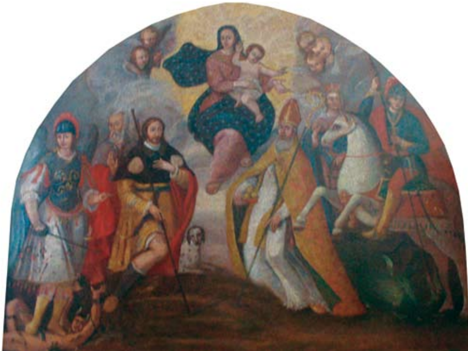
23. Filippo Naldi, Bogorodica s Djetetom, sv. Mihovilom, sv. Rokom, sv. Petrom, sv. Nikolom, i sv. Jurjem , Slivno Ravno (Neretva), Župna crkva sv. Stjepana Filippo Naldi, The Virgin with Child, St Michael, St Rochus, St Peter, St Nicholas, and St George, Slivno Ravno (Neretva), parish church of St Stephen