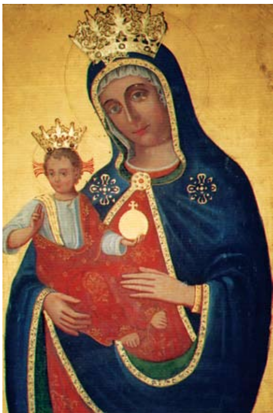
29. Filippo Naldi, Bogorodica s Djetetom , Žuljana, Župna crkva sv. Martina

Filippo Naldi, The Virgin, Žuljana, parish church of St Martin