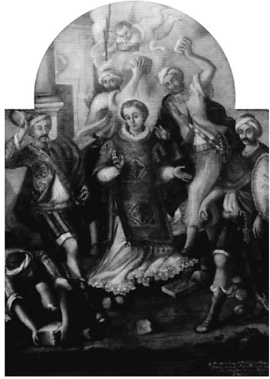
22. Filippo Naldi, Kamenovanje sv. Stjepana , Opuzen, Župna crkva sv. Stjepana Filippo Naldi, Stoning of St Stephen, Opuzen, parish church of St Stephen